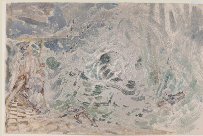
Εικόνα: T. Hennell, Οράματα ενός σχιζοφρενικού.